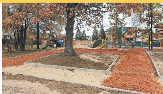
Na Placu Zgody powstają zielone płuca Marek.

Powstająca strefa relaksu będzie nieco inna od dotychczasowych istniejących już na terenie miasta. Prócz ścieżek o nawierzchni mineralnej, nowych ławek i koszy na śmieci, znajdą się dodatkowo parasole trzcinowe, leżaki ze stolikiem, stół betonowy z wkom-